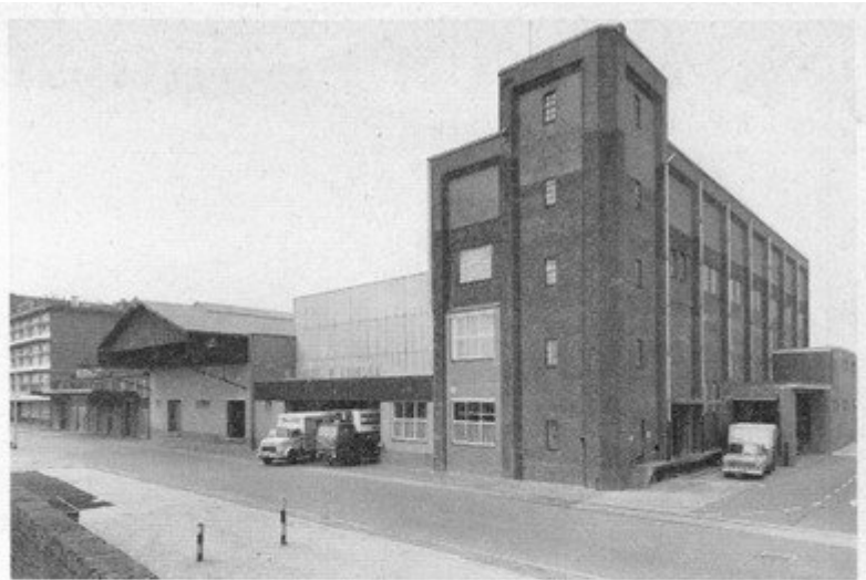
Voorzijde van het Koel- en Vrieshuis „De Landbouw” BV, zoals het er op het ogenblik uitziet.

De brief was verder een pleidooi om het koelhuis te doen voortbestaan in het belang van de agrarische industrie. Hoewel vrijwel uitsluitend zuivelfabrieken en zuivelinstanties positief reageerden, werd toch voldoende steun toegezegd. Inmiddels was gebleken dat de verkoping slechts een betrekkelijk laag bedrag zou opleveren. De FNZ bleek met de liquidatiecommissie tot overeenstemming te kunnen komen en op 7 juli 1923 werd in Den Haag de oprichtingsvergadering gehouden van de naamloze vennootschap „De Land-